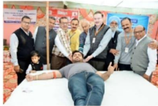
शिविर में रक्तदान करते हुए युवक।