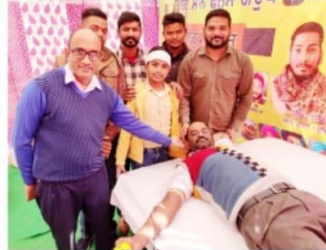
भगत सिंह चौक पर रक्तदान करते हुए लोग।